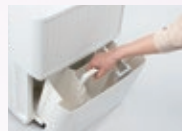
取っ手付きタンク 約6.5Lで自動停止。