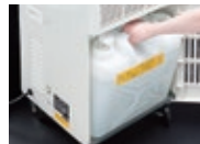
大型ドレンタンク(15L) 排水作業回数が少なく便利です。