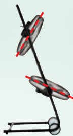
上下ファンをそれぞれ別角度に調節可能