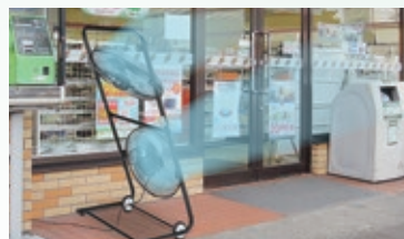
お店の入り口の虫よけとしてご使用できます。

オプション品 ・45cmアルミ3枚羽根 [IF4-3A] 【JAN:4511340110206】