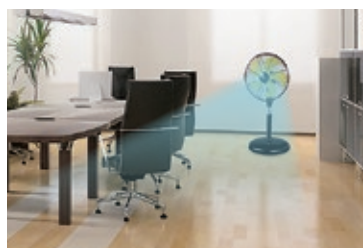
オフィス向けの一本脚タイプ

オプション品 ・45cmプラスチック5枚羽根 [DCF4-5R] 【JAN:4511340910813】